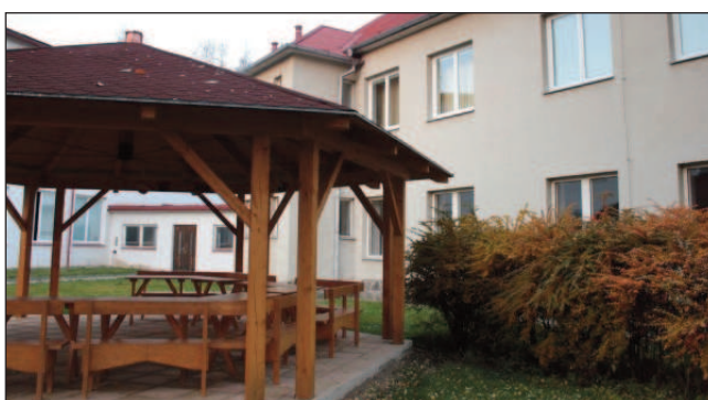
Výměna oken a dveří na budově ZŠ