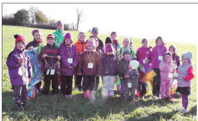
Vítězové letošní drakyády