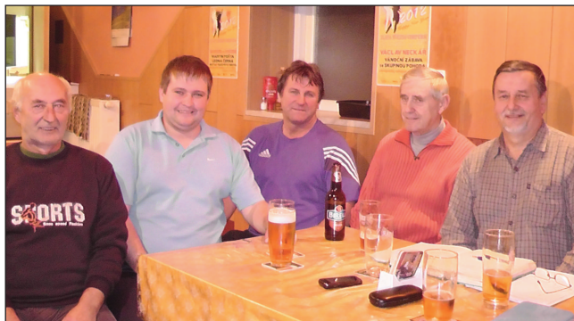
Největší kapacity čkyňského fotbalu

JD – Všechno bedlivě sleduju a mám radost z každého úspěchu. Hlavně z toho posledního, kdy jsme v derby porazili Lažiště. Jsem rád, že v těžších chvílích, které se během sezóny objevily, se kluci semkli. Míra Kainc výrazně zvedl sebevědomí hráčů a doufám, že přes zimu jim hodně naloží. Jsem pyšný na práci s naší mládeží, že ti kluci jak stárnou, tak postupují i našimi mančafy. To je krédo každého oddílu, aby se kluci z dorostu vypracovali až do áčka. Vždyť třeba mla-