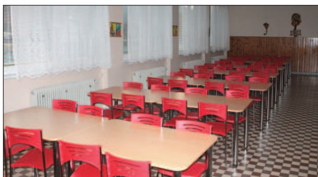
Nábytek do jídelny ZŠ