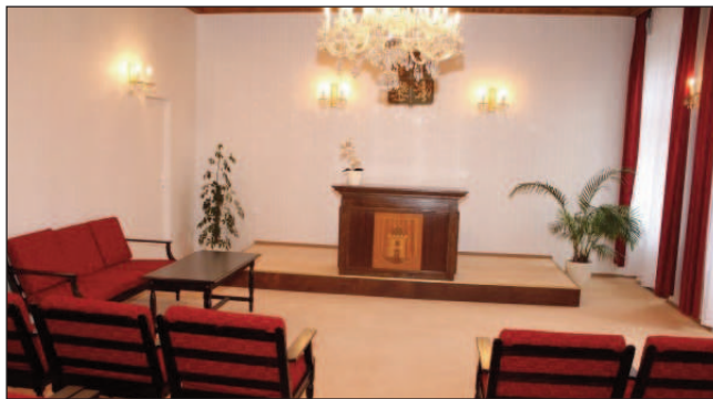
Obřadní síň na OÚ Čkyně