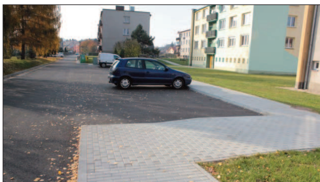
Chodníky a komunikace u řeky