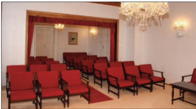
Obřadní síň na OÚ Čkyně