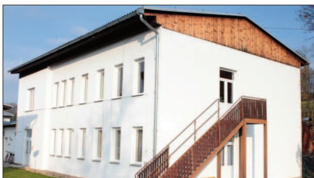
Výměna oken a dveří na budově MŠ