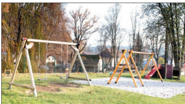
Houpačky u MŠ