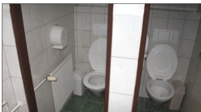
Toalety na 1. stupni ZŠ