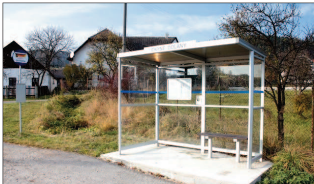
Autobusové zastávky (Dolany, Horosedly, Onšovice)