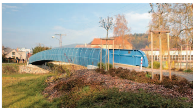
Lávka pro pěší a parková úprava