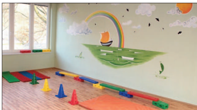
Nová třída v MŠ