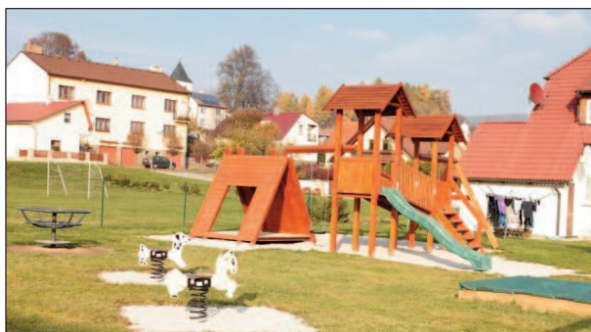
Hřiště pro nejmenší na "rovince"