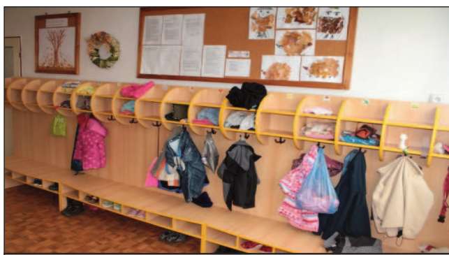
Nábytek do šaten v MŠ