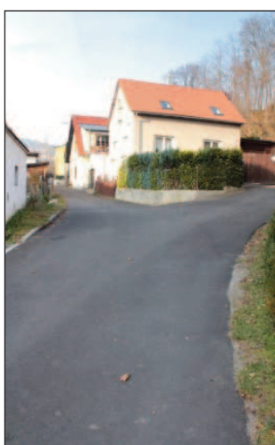
Komunikace za OÚ