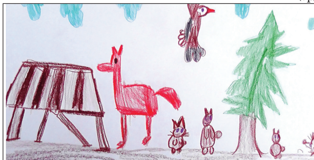
Zvířátka v lese