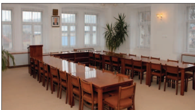
Podlahové krytiny na OÚ Čkyně