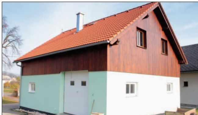
Fasáda hasičské zbrojnice Dolany